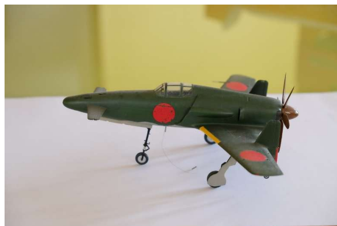
Kyūshū J7W1 Shinden

AACDL - ASSOCIATION DES AMIS DE CHARLES DE LOUVRIE (1821-1894)